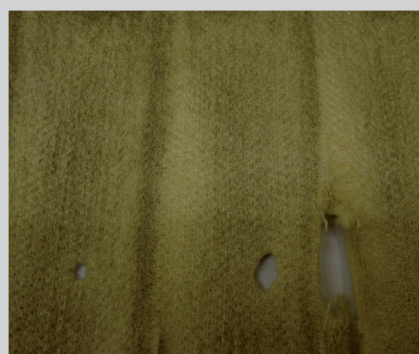
Untersuchung von Ausfallsursachen